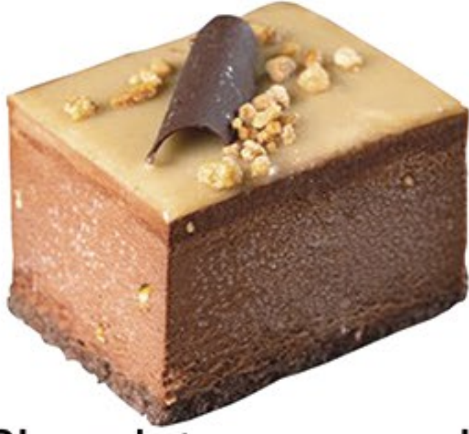
201.Chocolate con cacahuete tentación helada