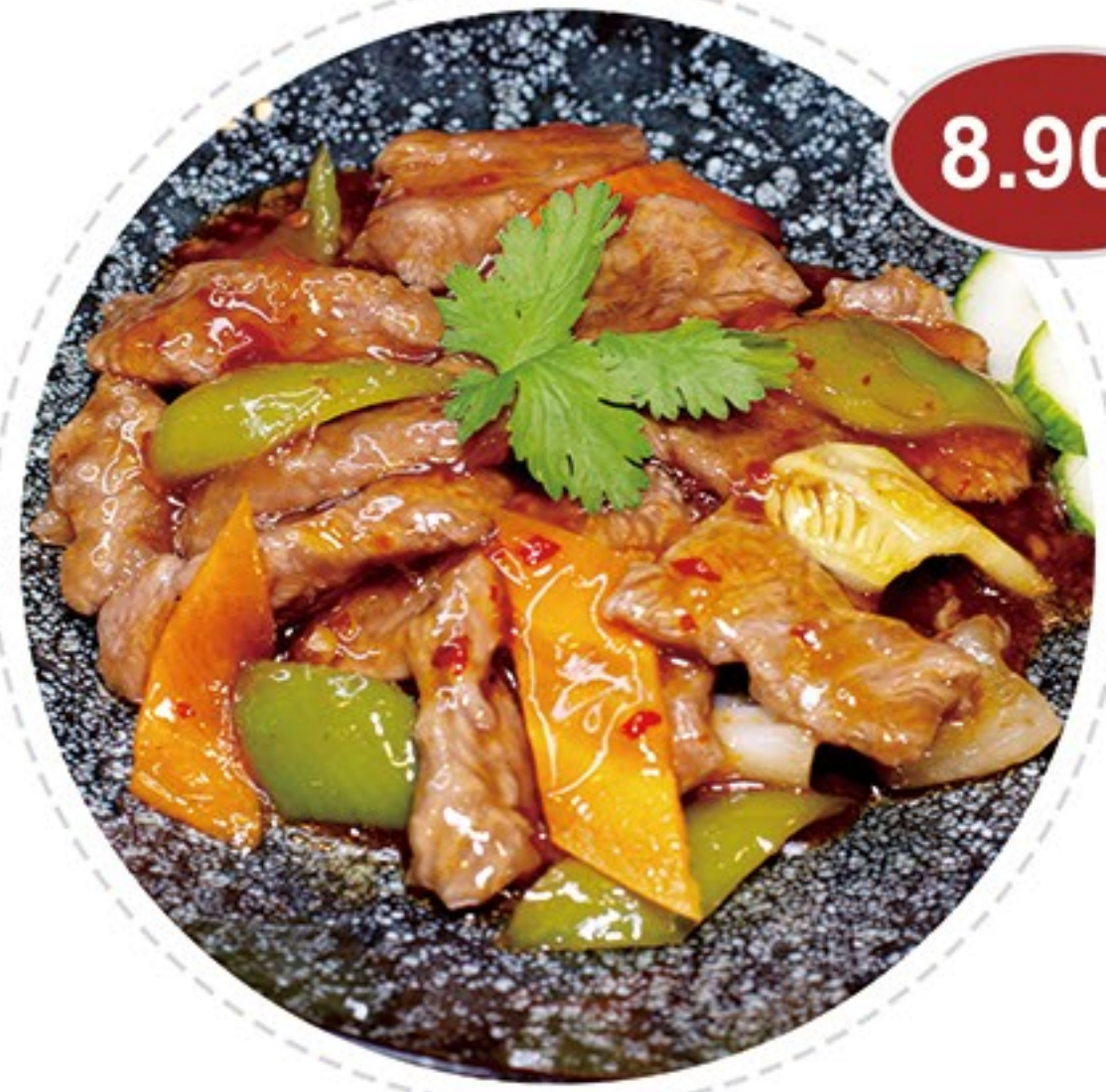
51. Ternera salsa picante Beef hot sauce