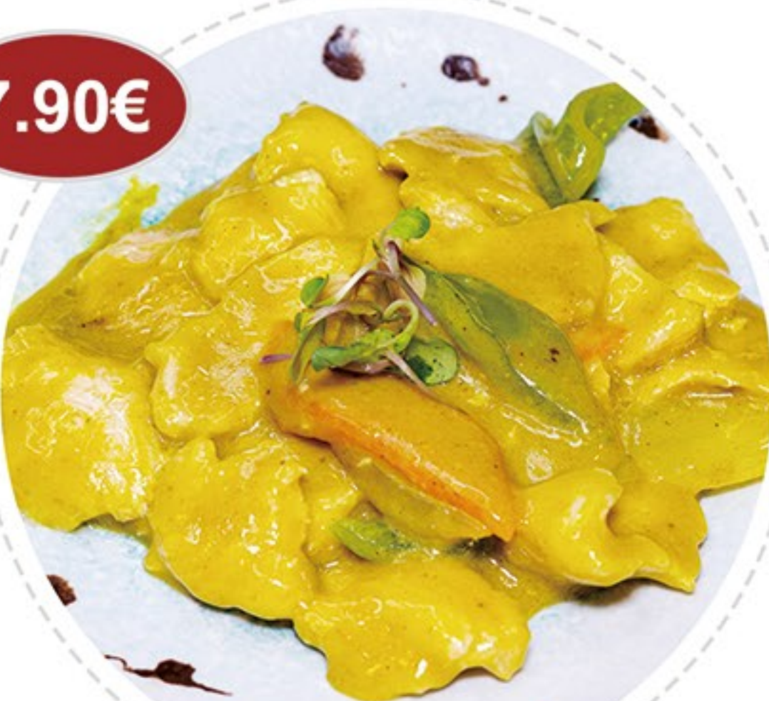
52. Pollo al curry Chicken curry