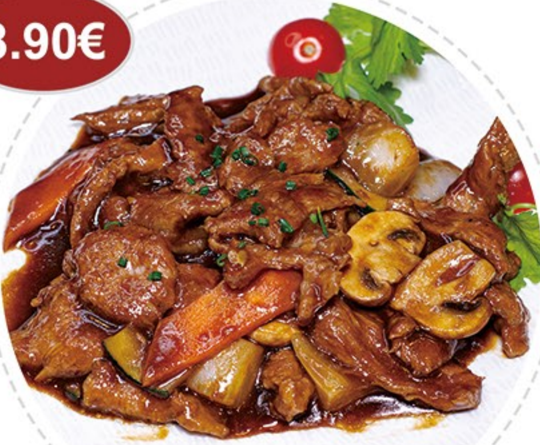
50. Ternera con salsa ostra Veal with oyster sauce