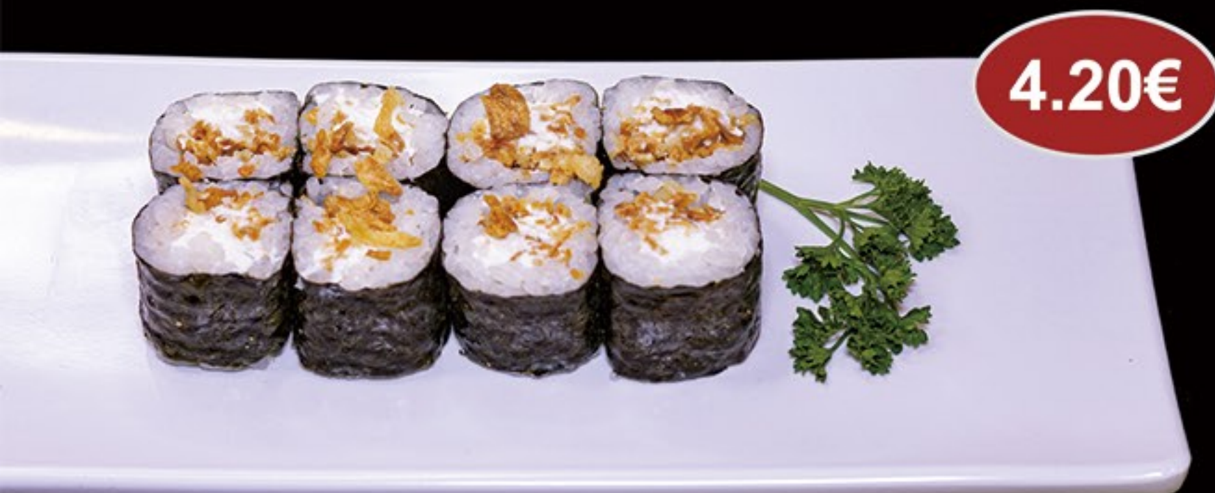
76.Cebolla con queso (8u) Onion with cheese