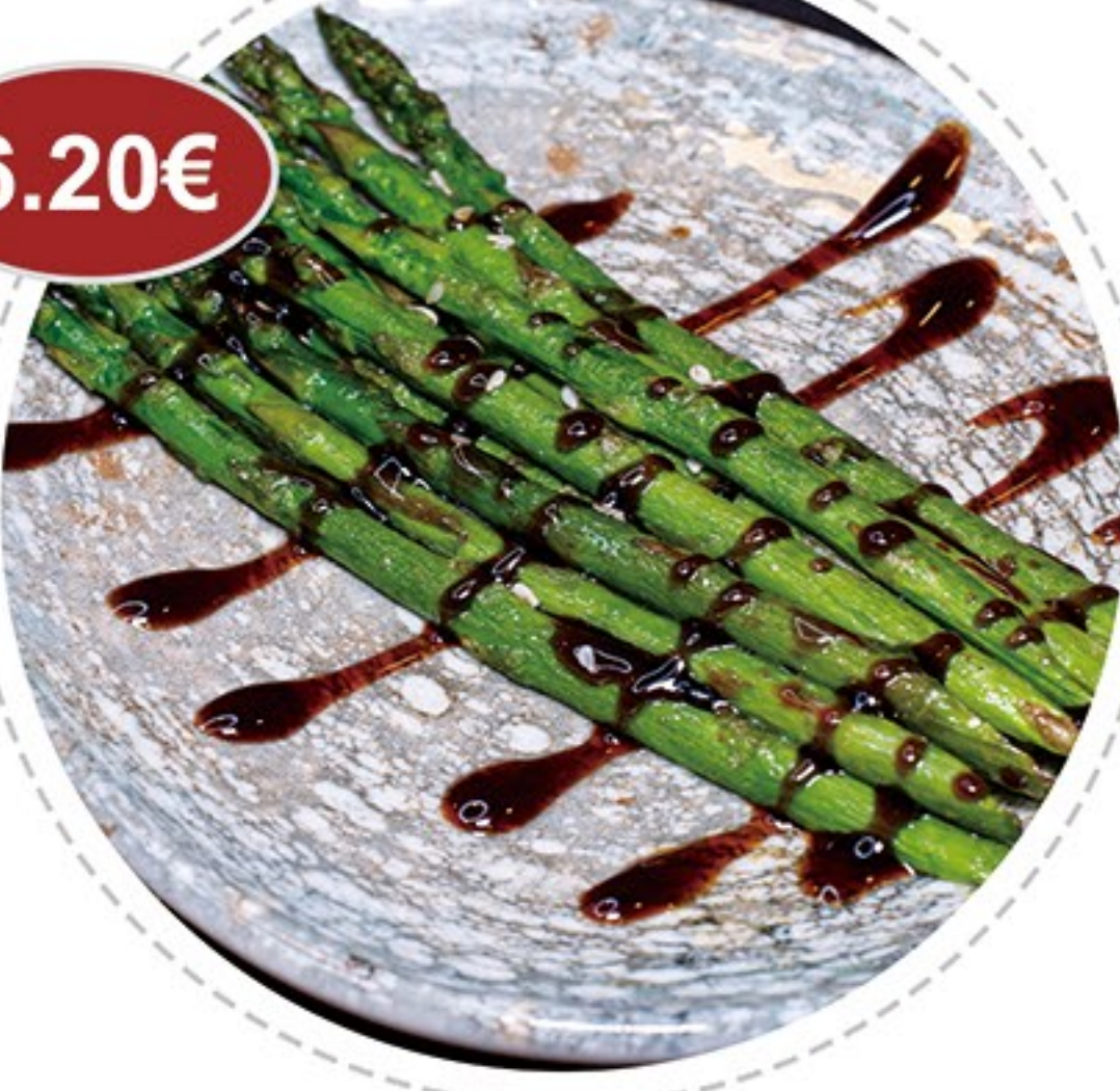
29. Esparragos a la plancha Grilled asparagus