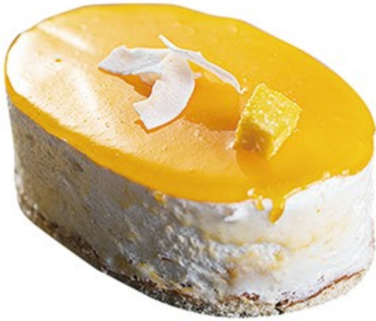
209.Coco y mango tentación helada Coco i mànec temptació gelada 5.20€