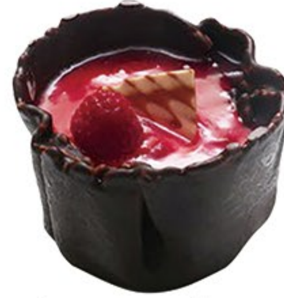
202.Too much queso fresco membrillo y ratafia

Too molt formatge fresc codony i ratafia