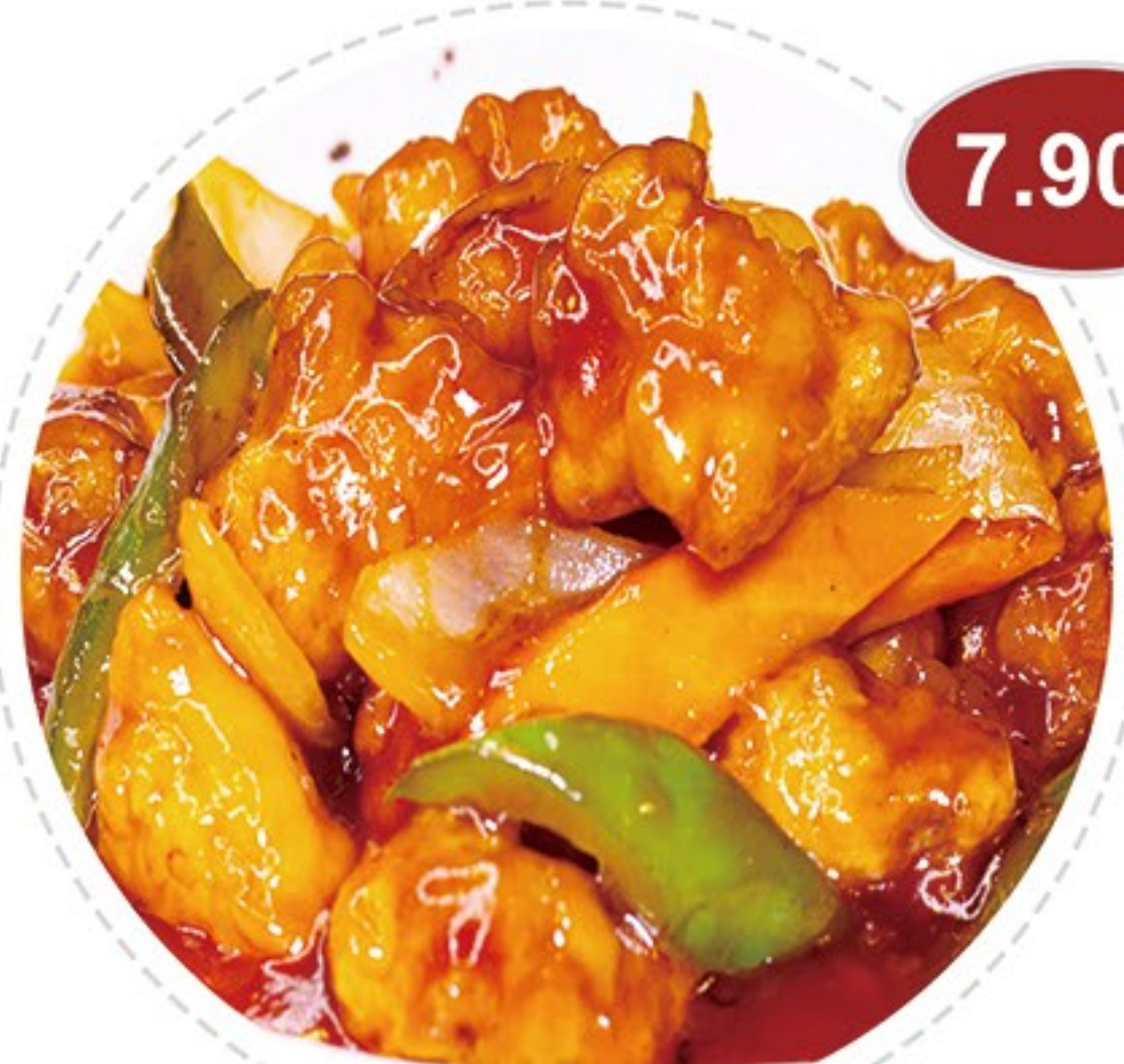
53. Pollo agripicante Hot and sour chicken