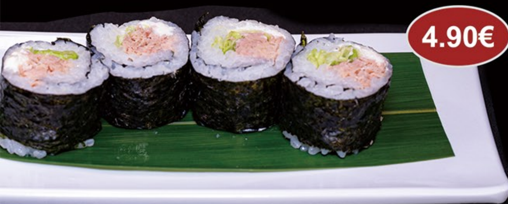
79.Futomaki de atun cocido lechuga y queso (4u)

Cooked tuna futomaki, lettuce and cheese