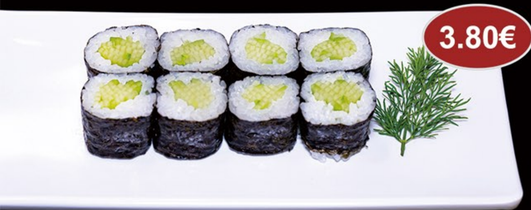
75.Pepino (8u) Cucumber