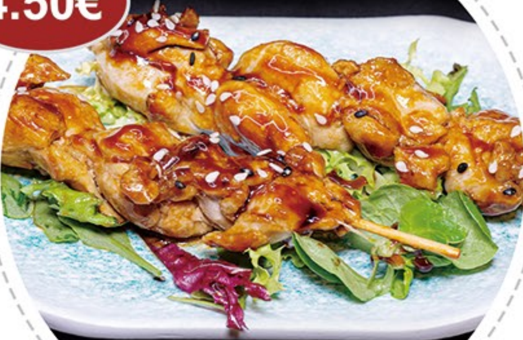
31. Pincho de pollo (2u) Chicken skewer