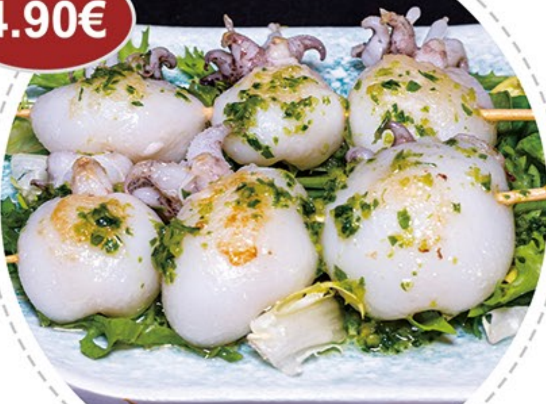
33. Pincho de sepia (2u) Cuttlefish skewer