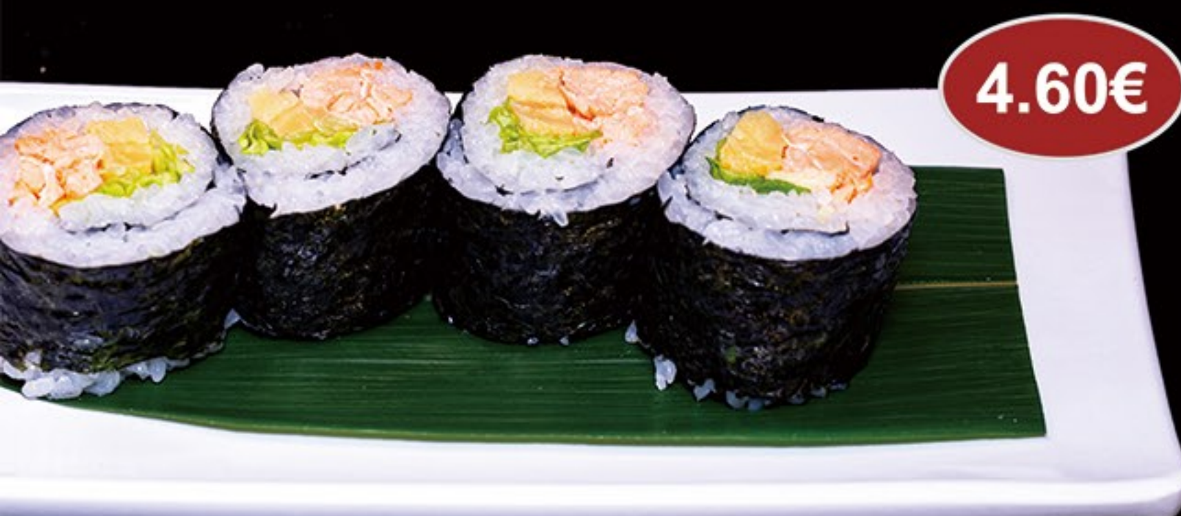
77.Futomaki salm3n cocido,mango y lechuga (4u)

Futomaki Cooked Salmon, Mango and Lettuce