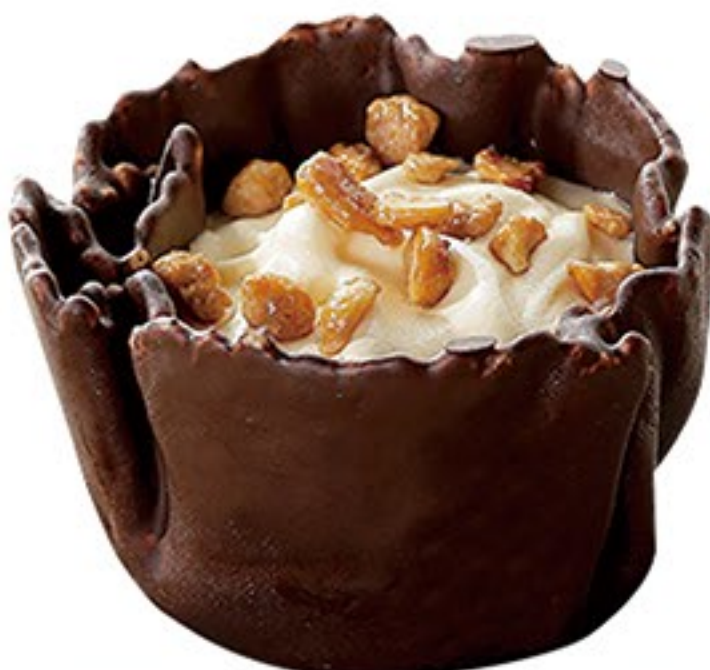
207.Too much vainilla y nueces de macadamia