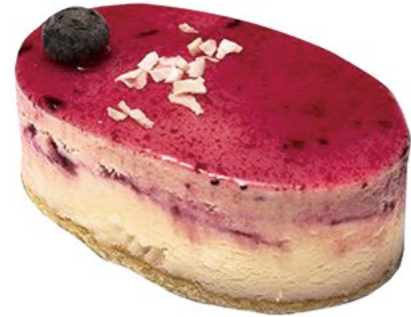
210.Coco y frutos del bosque tentación helada Coco i fruits del bosc temptació gelada 5.20€