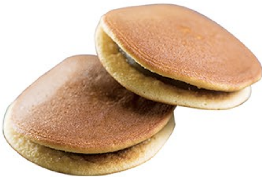
211.Dorayaki (Chocolate) (Xocolata) 4.20€