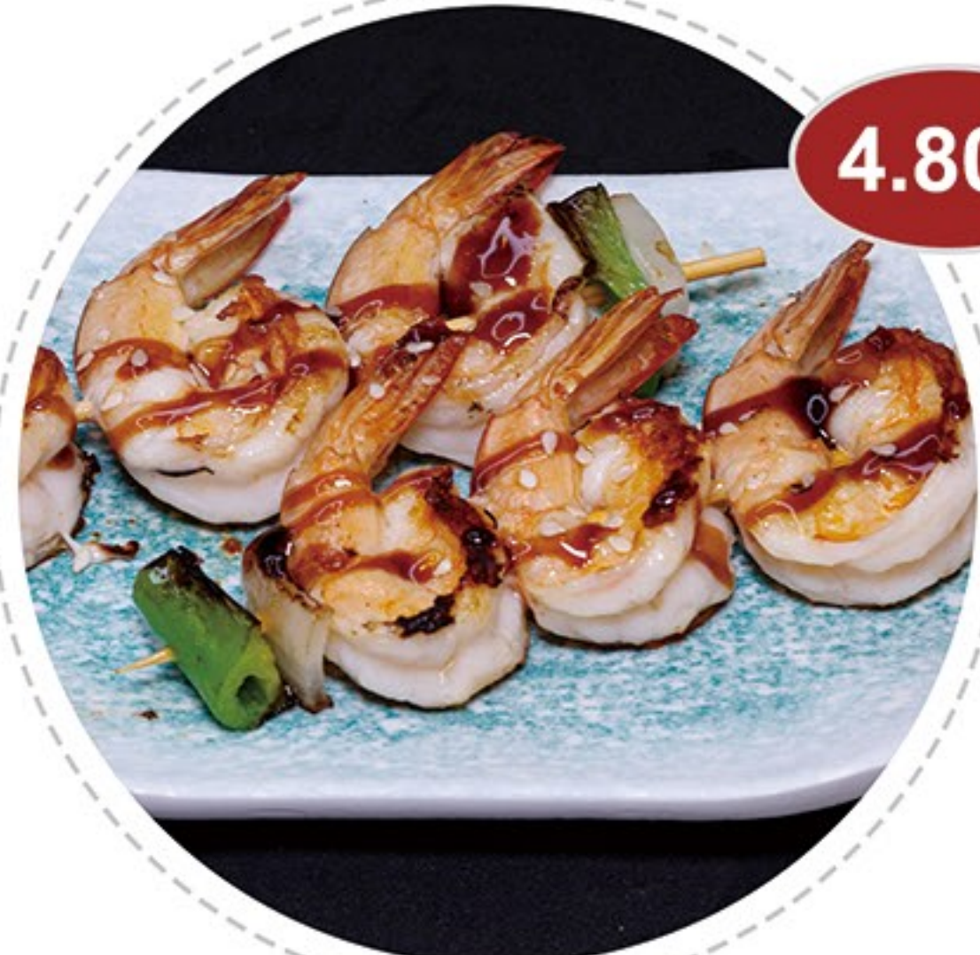
32. Pincho de gamba (2u) Prawn skewer