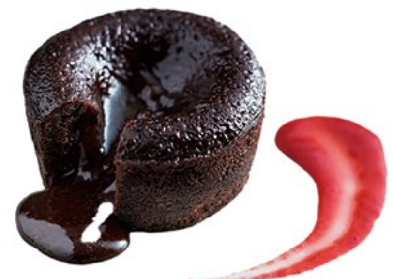
216.Coulant Coulant 4.50€