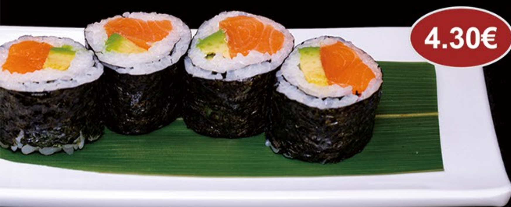
78.Futomaki de Salm3n y aguacate (4u)