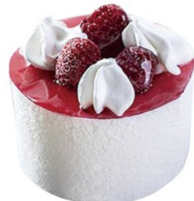
208.Yogur y frambuesa